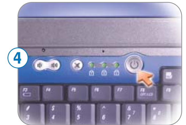
4 Power Button Bouton d'alimentation Botón de alimentación