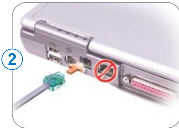
2 Modem Modem Módem