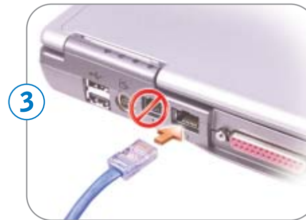
3 Network Réseau Red